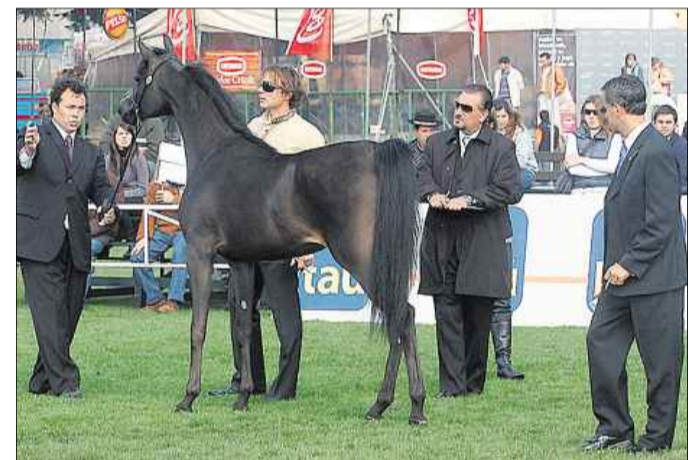
Con futuro. Los mejores Árabes fueron animales jóvenes.

Por un tema de espacio, la cobertura completa de esta raza se brindará en la edición de mañana domingo.